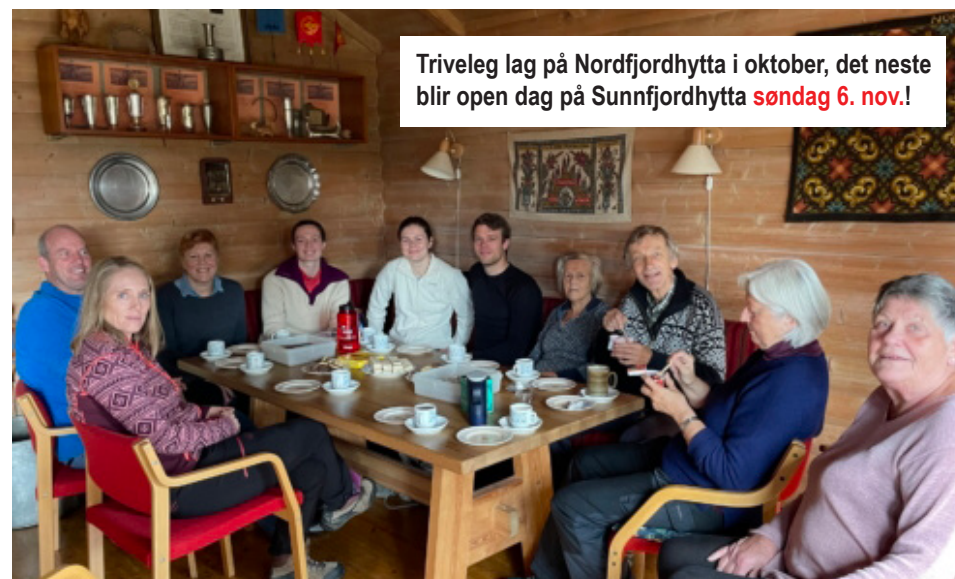
Triveleg lag på Nordfjordhytta i oktober, det neste blir open dag på Sunnfjordhytta søndag 6. nov.!