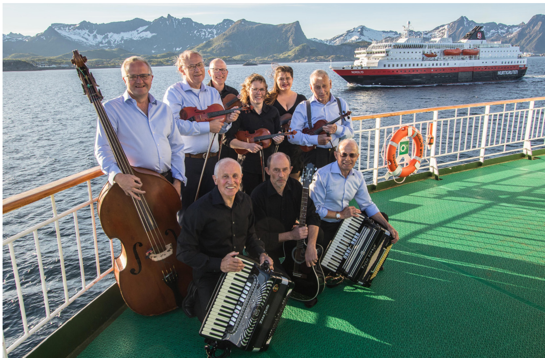
Austrheim Musikk-lag spela seg nordover med Hurtigruta i juni i år.

Dei er eit av dei aller eldste spelemannslaga i heile landet, har spela både heime og ute i årevis og gledt sær mange. I 2007 spela dei i alle 26 kommunane i fylket vårt. I år har dei spela i alle våre fylke og toppar det heile med å spela på haustfesten vår – stort! Dei spelar allsidig og god danse- og tango musikk – også med swing og tango iblanda.