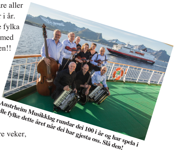
Austrheim Musikklag rundar dei 100 i år og har spela i alle fylke dette året når dei har gjesta oss. Slå den!

Alle opplysningar om påmelding og prisar kjem i neste nr. av Tre Fjordar – om eit par-tre veker, men set av kvelden alt no!