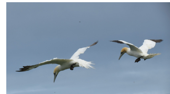
Havsnik i flukt.

28. juli skulle vi på tur til havklippene ved Vestmanna. Hilda hentet oss med bussen halv ni, og vi kjørte nordover til Vestmanna, hvor båt ventet oss. Vi skulle på båttur ut til fugle- fjellene, klippene og grottene. I litt ruskevær kjørte vi utover havet, på turen utover kunne vi også her se sauer som beitet i de bratte skråningene ned mot havet.