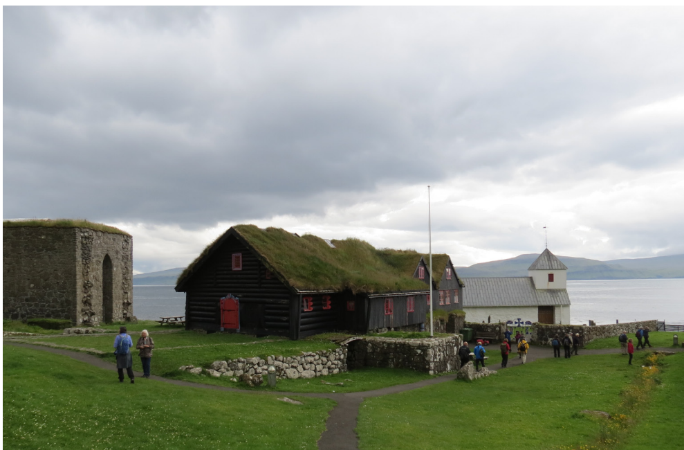
KYRKJEBØ: Magnuskatedralen (ruin) til venstre, Olavskirke til høyre og kongsgarden (med røykstova) i midten. Det historisk mest interessante stedet på Færøyene.

Så var det tid for å kjøre med bussen tilbake og spise middag i Tórshavn.