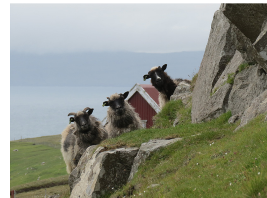
Utgangspunkt på Færøyene.

Etter omvisningen var det innsjekking på hotell Streym, hvor vi fikk en kort informasjon om Olavsfesten de neste 2 dagene og en kort pause før vi var klar til middag.