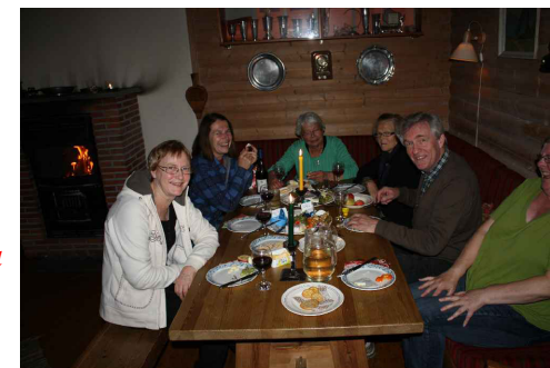
Det er alltid god stemning under osteselskapet