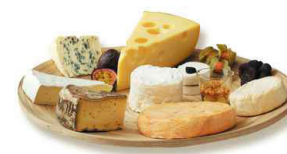
Osteselskap på Nordfjordhytta 24. september