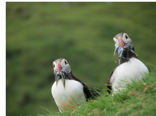
Lundefugl med fangst i nebb.

Så bar det rett til flyplassen, vi sjekket inn bagasje og inn på Atlantic Airways airbus til København, videre med SAS til Oslo og Gardermoen, hvor vi landet sent på kvelden.