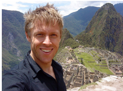
Gunnar Garfors i Machu Picchu i Peru.

Klubbefesten vert laurdag 5. november , i pakt med tradisjonane. Denne gongen med markering av skipinga av Sunnfjordlaget for 100 år sidan . Gunnar Garfors og Indre Sunnfjord Spelemannslag kjem og gjev kvelden sunnfjordpreg.