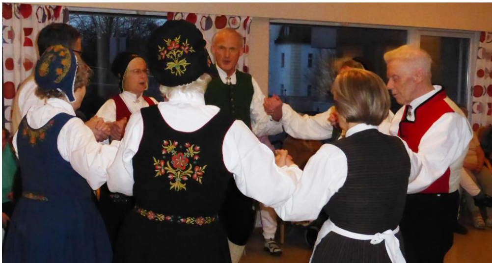
Songdans, truleg "Vise for gærne jinter".