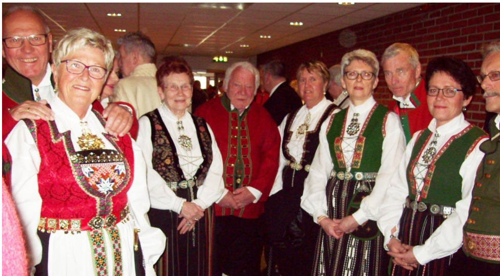
Et knippe med ukjente, velklede Vestlendinger som poserte velvillig.