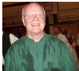
"En bussjåfør, en bussjåfør, det er en mann med godt humør, - - -