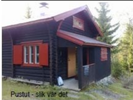
Pustut - slik var det