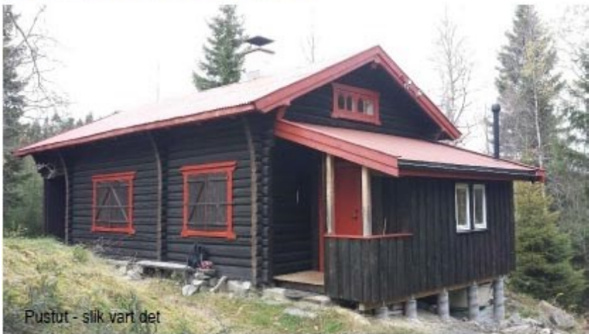
Pustut - slik vart det