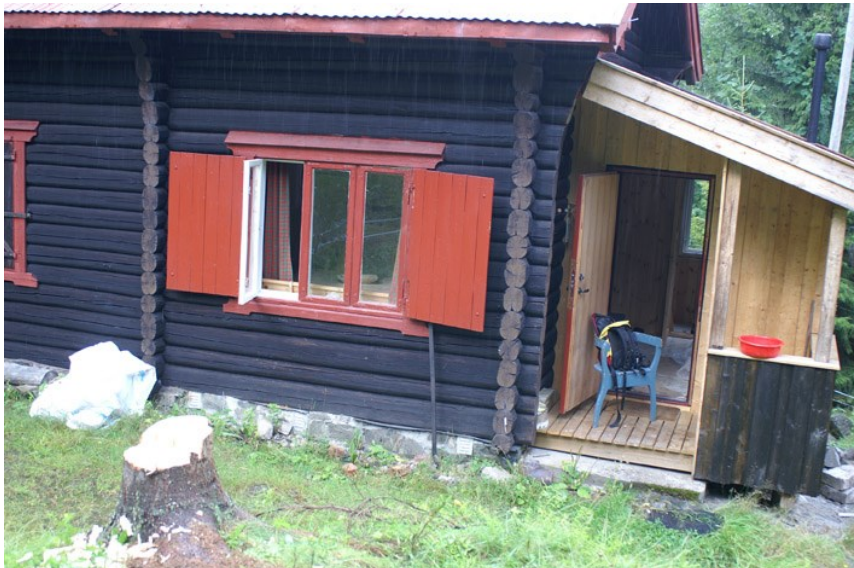
Biletet syner det nye tilbygget til hytta.