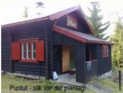
Pustut - slik var det planlagt