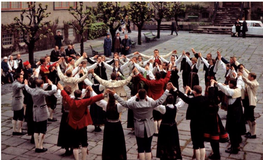
Bygdelagsstemne på Torget på Folkemuseet i 1966.

Det årlege Bygdelagsstemnet, som er fylkesstemne i NU, blir som vanleg arrangert på Folkemuseet på Bygdøy søndag 2. juni. Markerast skal også at det er 90 år sidan Bygdelagssamskipnaden starta. Programmet kjem i neste Tre Fjoridar. Følg og med på http://www.bls.no .