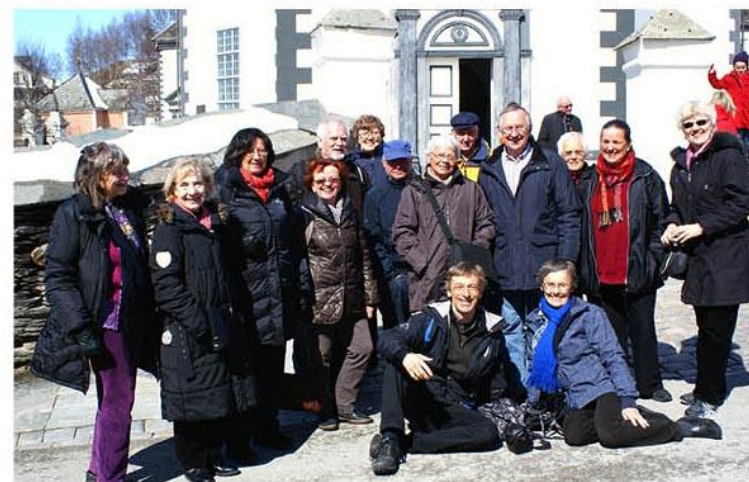
Søndagen gjekk mest halve ringen i kyrkja (og sanna sine (unnlatings-)synder) – før "attpålaget" med meir dans og prat i Sangerhuset, til musikk av mange gode spelemenn.