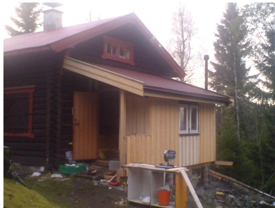
Frå arbeidet med tilbygget.