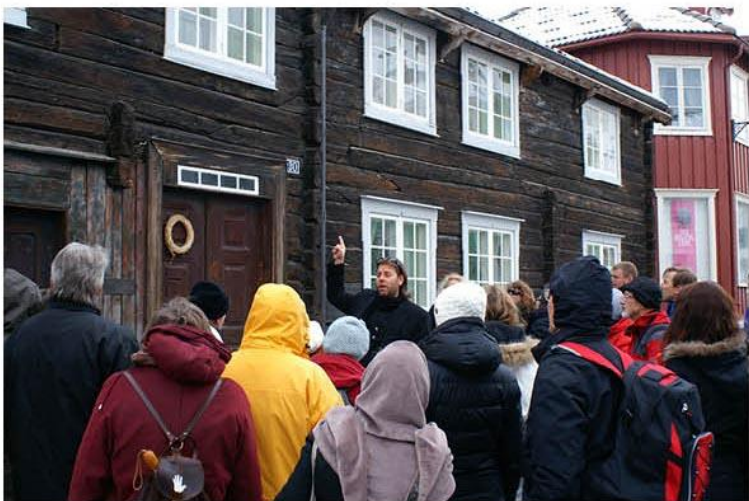
Røros-guiden vår var leiari i det lokale Fortidsminnelaget, synte oss m.a. Per Amundsagården, som Fortidsminnefor. eig og leiger ut til medlemmer. Foreininga eig også Rasmusgården lenger nede i Bergmannsgata.

Han viste oss også 'fattigkvarteret' i Sleggveita ved Slegghaugane.