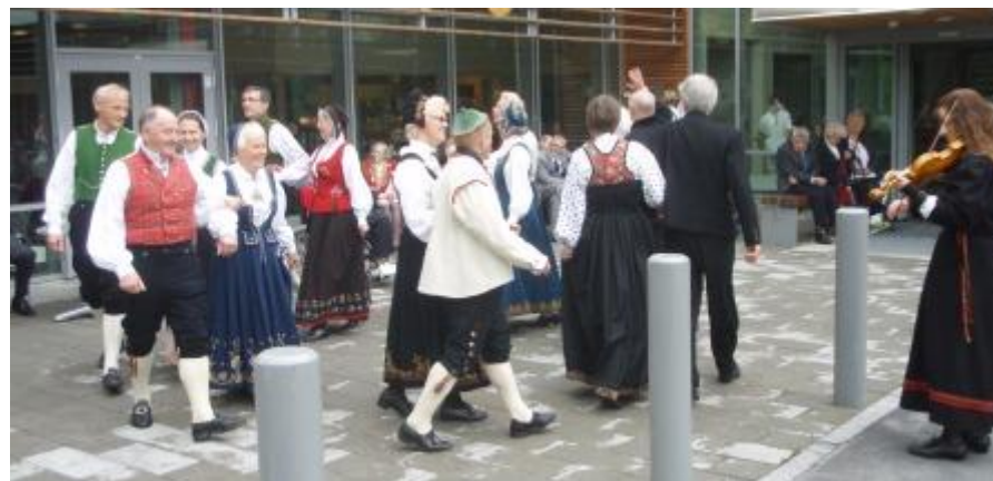
Frå dansinga i 2010.

Kl. 20:00 starter dansen i Nordahl Brunsgate 22.